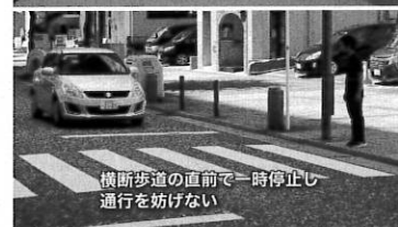
横断歩道の直前で一時停止し 通行を妨げない