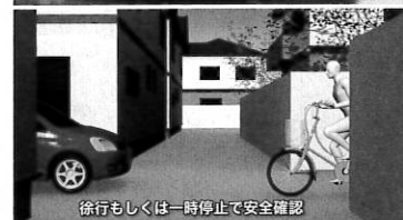
徐行もしくは一時停止で安全確認