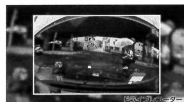
ドライブレコーダー